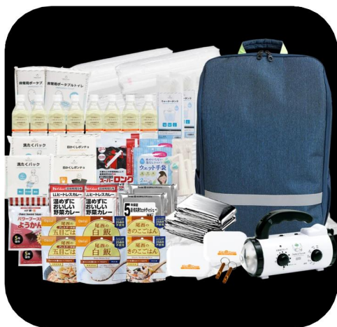
防災グッズの一例です

今年度の開催予定日は毎月第3月曜日ですが、来月は変則、 1月15?日 を 予定しています。引き続きご参加下さい。